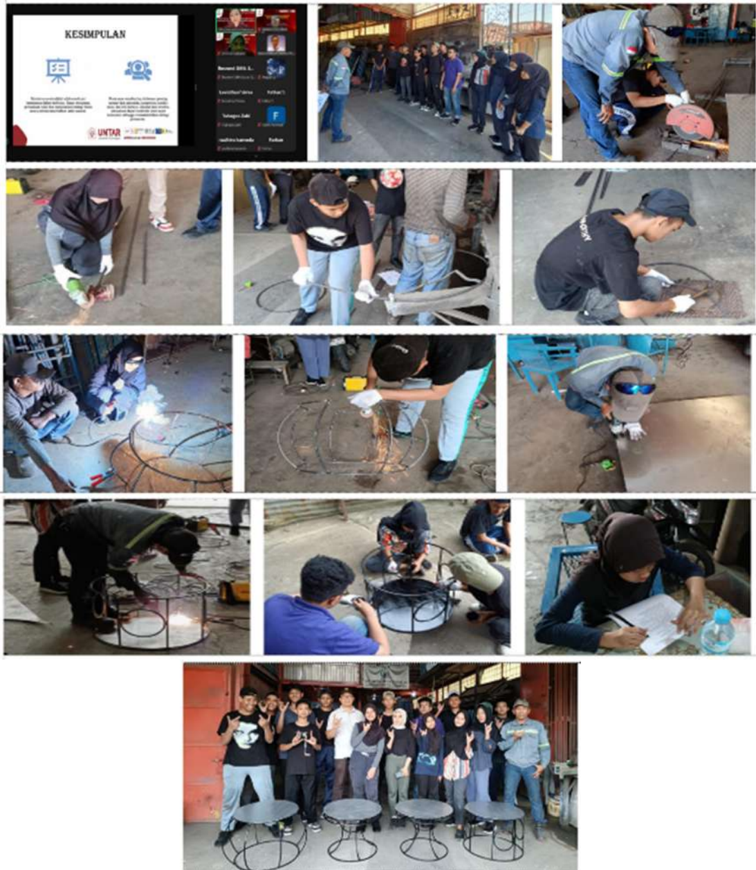
Gambar 5. Dokumentasi setiap tahapan pembuatan meja berbahan besi nako

Pada hari kedua, peserta melakukan praktik langsung di bengkel untuk pembuatan meja taman. Gambar pemaparan teori dan praktik dapat dilihat pada Gambar 5 di bawah ini.