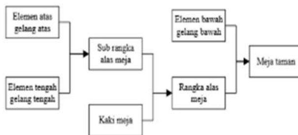
Gambar 6. Diagram perakitan meja taman