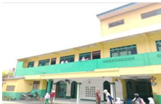
Gambar 1. Sekolah SMA Sunan Bonang Tangerang Banten

Untuk menggali informasi di sekolah, ketua PKM melakukan diskusi dengan sejumlah siswa dan wakil guru. Sebagai hasil diketahui bahwa materi pelajaran dan keterampilan yang berkaitan dengan studi desain produk tidak diajarkan. Sekolah konsentrasi pada materi pelajaran sesuai kurikulum yang dijanjikan. Hal yang sama terjadi ketika datang ke kemampuan dan praktik pembuatan produk. Kondisi ini mengakibatkan, pengetahuan, pemahaman dan keterampilan siswa masih rendah, terutama dalam keterampilan perancangan produk komersial dan keterampilan dalam pembuatannya. Secara lebih rinci permasalahan yang dihadapi mitra yaitu: